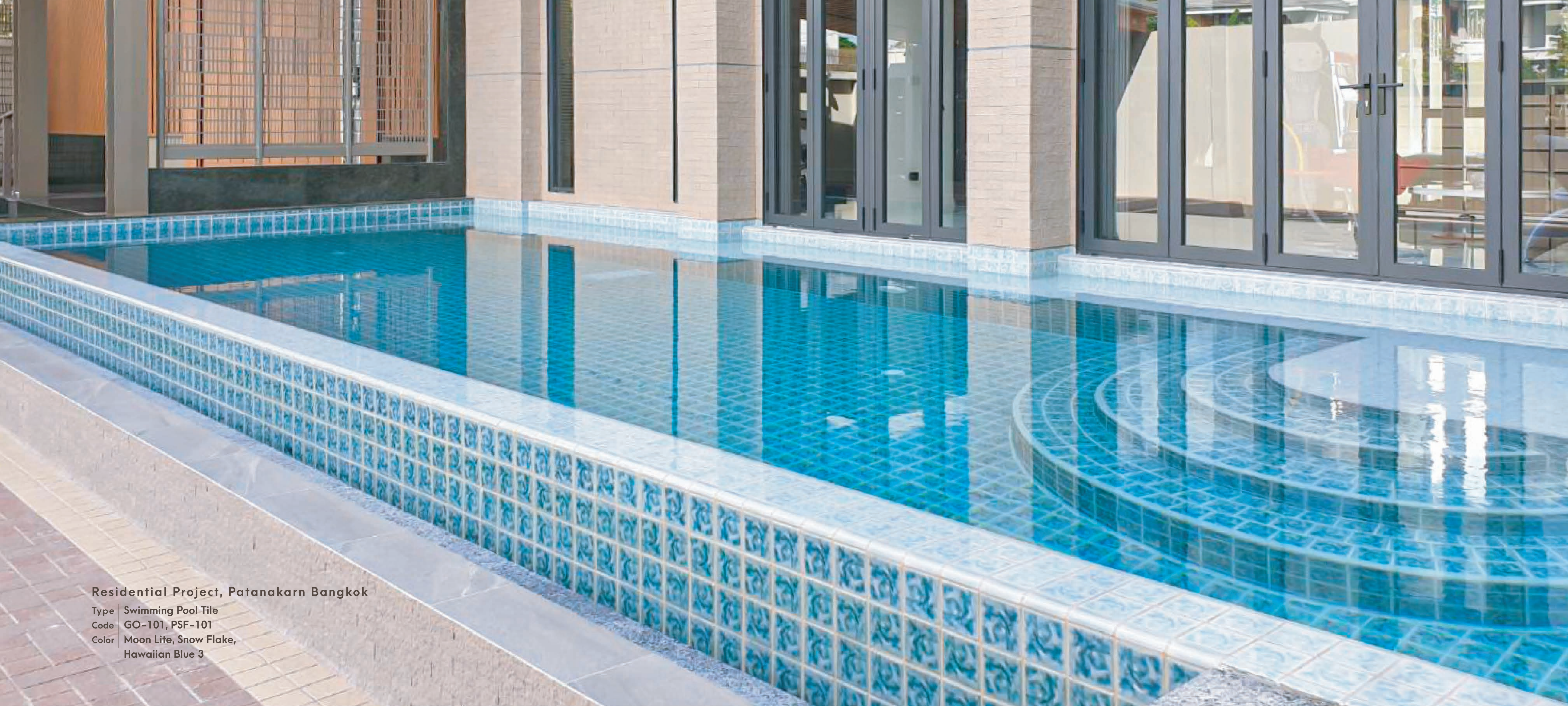
Residential Project, Patanakarn Bangkok

Type Swimming Pool Tile Code GO-101, PSF-101 Color Moon Lite, Snow Flake, Hawaiian Blue 3