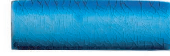
Hawaiian Blue 1 ฮาวายันบลู 1