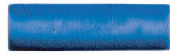
Hawaiian Blue 2 ฮาวายันบลู 2