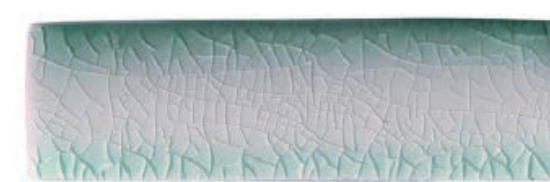
Jade Green จาดกรีน