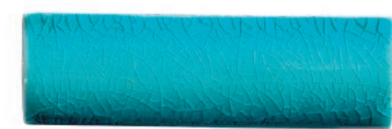
Andaman Green 2 อันดามันกรีน 2