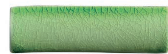
Andaman Green 3 อันดามันกรีน 3