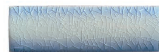
Snow Flake สโนว์เฟลิก