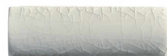
Moon Lite มูนไลท์

* สีของผลิตภัณฑ์ อาจแตกต่างจากสีในรูปเล็กน้อย เนื่องจากภาพพิมพ์