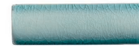
Andaman Green 4 อันดามันกรีน 4