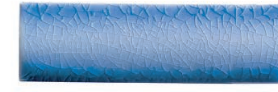
Hawaiian Blue 3 ฮาวายันบลู 3