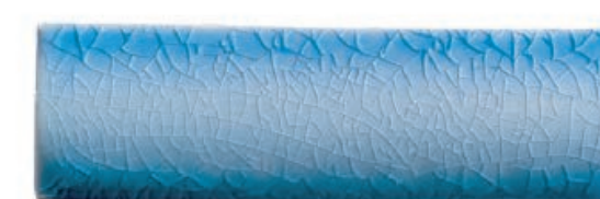
Blue Lagoon บลูลาagoon