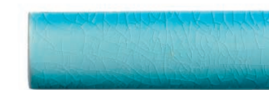
Andaman Green 1 อันดามันกรีน 1