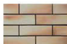
Smoky White สีไม้กึ่ง ขาว