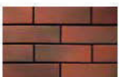
Red Wood เรด ไม้