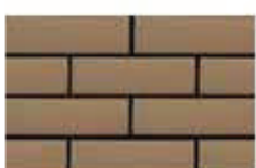
Brick Brown น้ำตาล