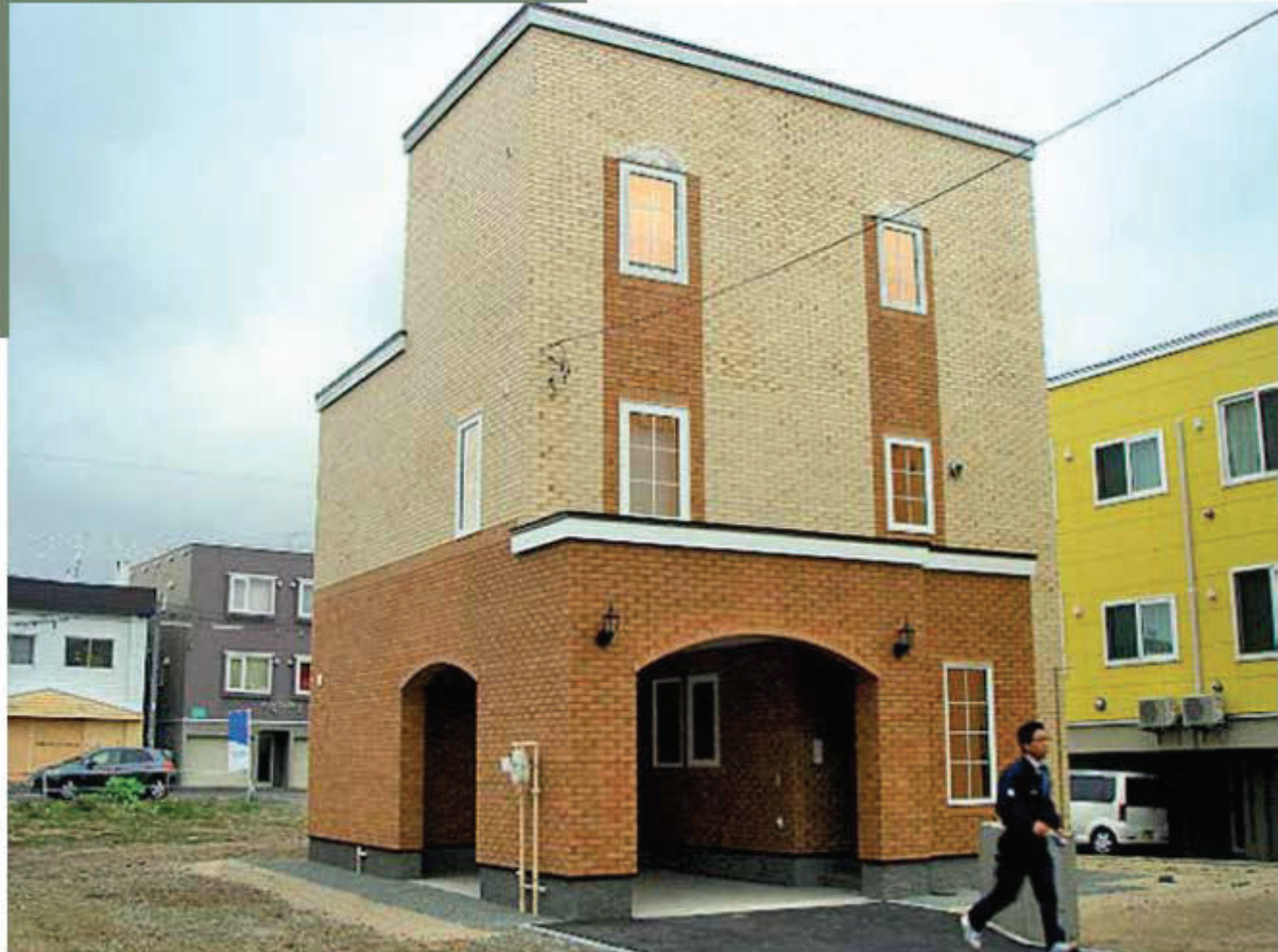
Inter Lock : HT-201 / Color : White, Brick Brown