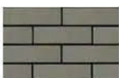
Silver Grey เทา