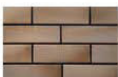
Foggy Grey สีเทา กึ่ง ฟ้า