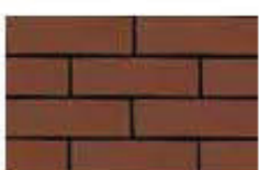
Wine Red แดง